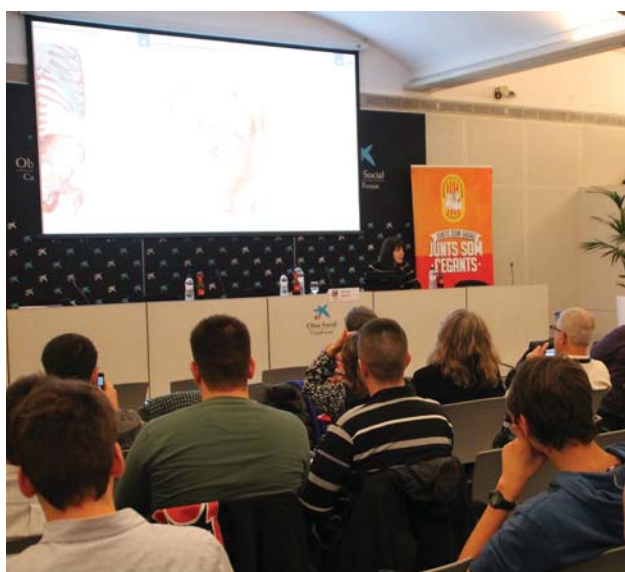
> Darrera sessió referent al patrimoni festiu de País Gegant al Caixaforum de Barcelona.

Així doncs, l'esdeveniment tindrà una part que estarà centrada a debatre el fet geganter a nivell mundial i que comptarà amb la presència d'experts en la matèria que parlaran sobre l'evolució de les figures, les festivitats en les quals participen o les diferències entre diverses zones. Però, la idea d'aquesta Trobada i Congrés Internacional és fer que tothom