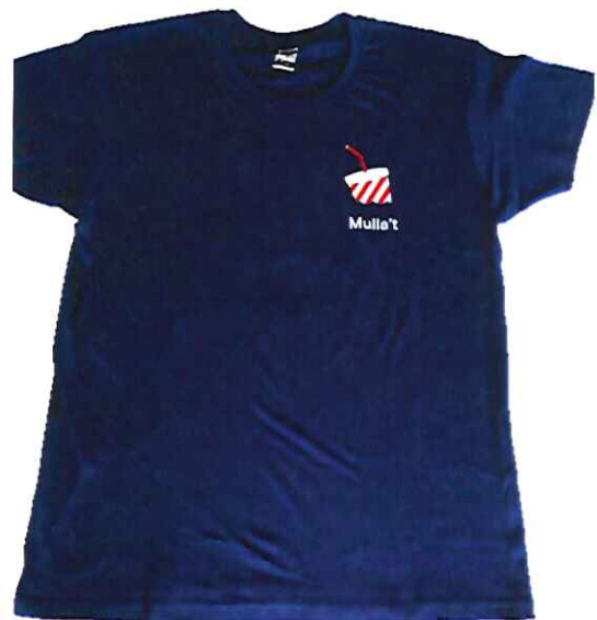
SAMARRETA HOME 12€ XS - S - M - L - XL - XXL